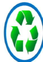
ความยั่งยืน