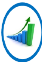
ความมั่งคั่ง