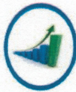
ความมั่งคั่ง